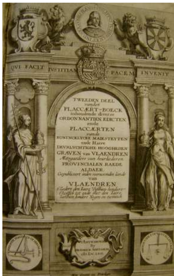
Rijksarchief Gent. Collectie oude drukken. Tweeden deel van den Placcaert-boeck van Vlaendren Antwerpen (bij Hendrick Aertssens), 1662, voorblad.